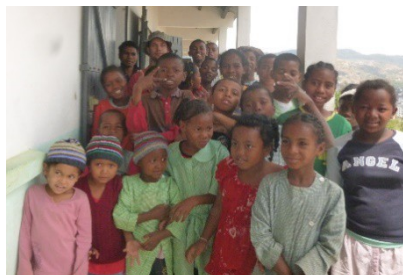
Les élèves et moi à l'école de Fianarantsoa