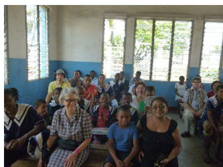
L'équipe, la responsable et ses élèves à l'école de Tamatave

Ensuite, après avoir loué un 4x4 avec chauffeur-guide, nous sommes partis de la capitale Tananarive pour aller à Tamatave : le trajet a duré 6h sans encombre. A l'arrivée, le directeur nous a très bien accueillis à l'école SEMATO où nous avons été présentés au personnel et à tous les élèves. Durant cette petite réunion improvisée, le matériel éducatif venant de la France (livres, jeux de société, posters, peluches, vêtements, etc..) leur a été distribué. Les enfants, déjà émerveillés par notre venue, étaient très heureux de les recevoir. Ensuite, nous sommes allés dans une librairie où nous avons pu acheter avec l'argent récolté de l'association, tout le matériel scolaire dont l'école avait besoin. Après avoir déjeuné dans un restaurant de spécialité locale, nous sommes revenus à l'école pour distribuer les fournitures scolaires aux élèves. La journée fut belle et enrichissante au niveau de l'ambiance et de la convivialité.